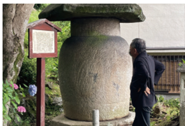
隈研吾氏とともに三井寺別所界隈をめぐる