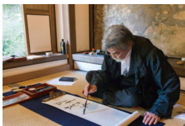
光浄院客殿の付書院で一句したためる