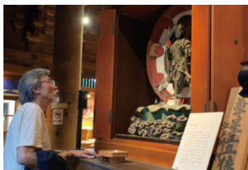
三井寺金堂にて尊星王像をみる